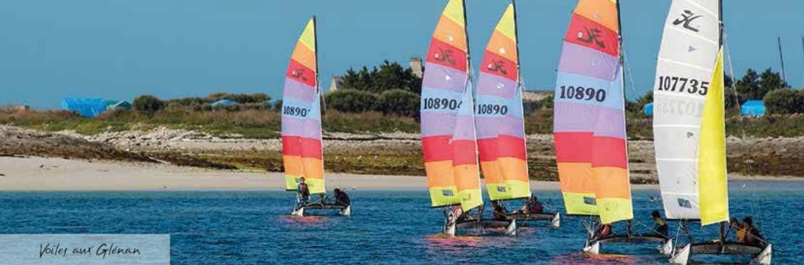
Voiles aux Glénan