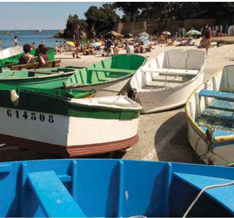
La cabà Beg Meil